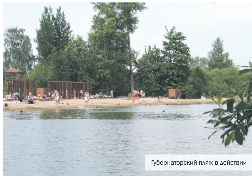
Губернаторский пляж в действии

Несмотря на запреты Роспотребнадзора и режим ограничений, связанных с пандемией коронавируса, как только теплеет, местные пляжи заполняются народом.