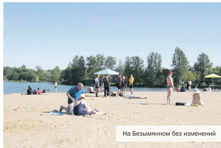
На Безымянном без изменений